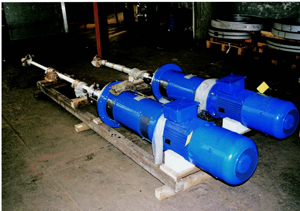
Agitatori con pale ad elica in AISI 316 con motore da 11 kW Mixers with blades in AISI 316 with 11 kW motor

As regards their manufacturing, they comply with machine directive 98/37/CE of the European Community and directive ATEX.