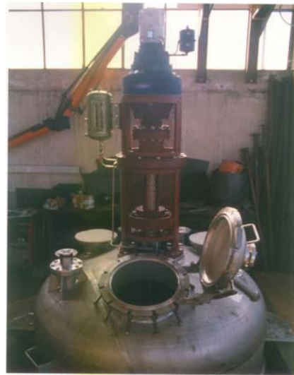
Particolari interno e lanterna agitatore per mescolatore da L 3500 Interior details and mixer's lantern for 3,500 L mixer