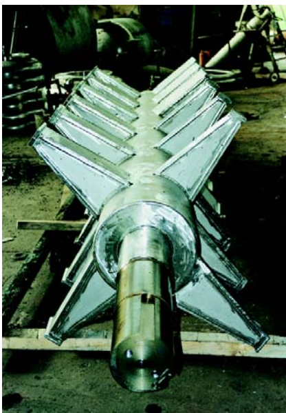
Albero lento per essiccatore riscaldato internamente Ø 1200 in AISI 316 collaudato ISPESL Slow shaft for internally heated dryer, 1200 L in AISI 316, ISPESL tested