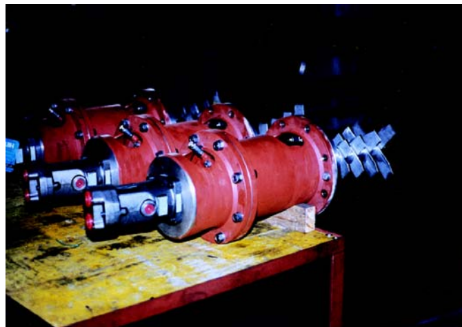
Frantumatori ad azionamento oleodinamico "choppers" Oleo-dynamic enabled breakers "choppers"