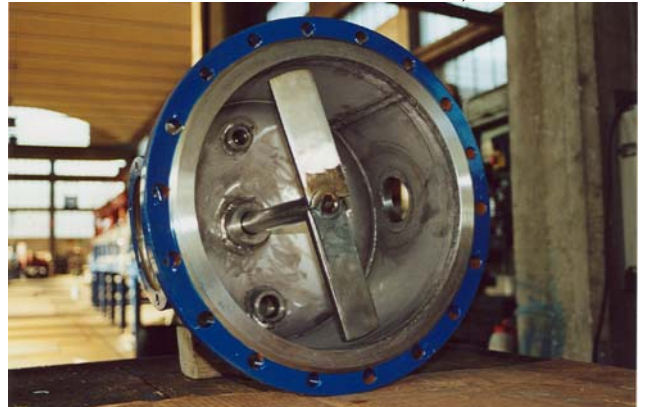
Vista interna del pressofiltro da laboratorio DN 300 smontato Interior view of laboratory press filter DN 300, disassembled