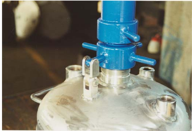
Particolari di costruzione filtro pressa DN300 Construction detail of filter press DN300

I materiali di più largo impiego utilizzati nelle costruzioni, la cui scelta è determinata dal processo di lavorazione e dai prodotti trasformati, sono i seguenti: