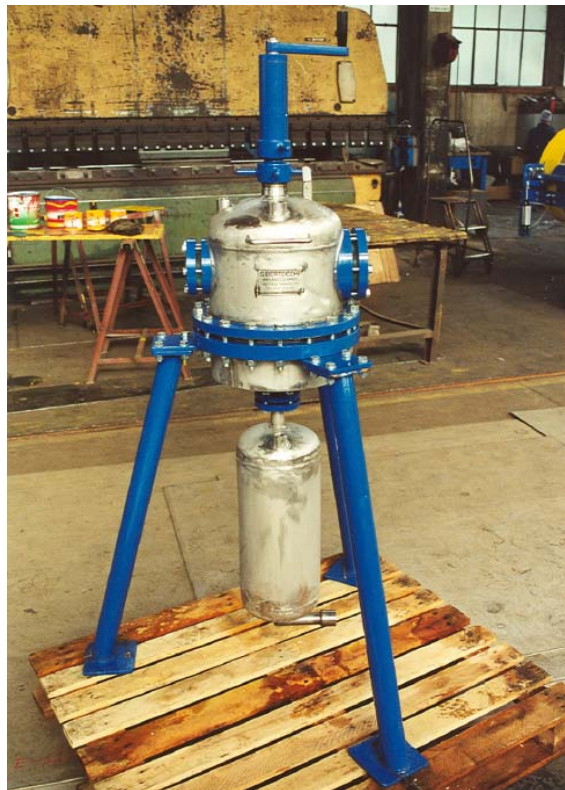
Filtro pressa DN 300, da L tot. 24 in AVESTA 904L con collaudo interno Press filter DN 300, of 24 L in total, in AVESTA 904L, tested internally

Special vessel (available at our office) for heavy uses at average temperatures and pressures, free of jacket and lateral exhaust valve, with mixing, pressing, and scraping functions of the products contained. It is envisaged the option of an internal mixer with axial movement and manually enabled rotation.